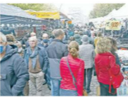
BANCarelle Sono migliaia le persone a spasso in città ogni giorno