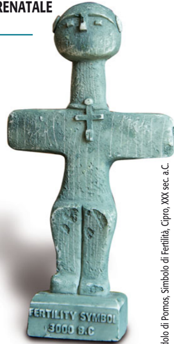
Idolo di Pimos, Simbolo di Fertilità, Cipro, XXX sec. a.C.