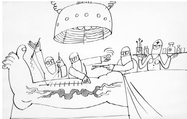
Vignetta preparatoria del film d'animazione sulla cura delle varici, prodotto da Glauco Bassi nel 1973.

Esso contiene inoltre l' abstract di oltre diecimila articoli di riviste scientifiche e di decine di testi di argomento flebo-angiologico, che Bassi redige in quarant'anni di attività, dal 1947 al 1987, raccolti e classificati secondo un preciso ordinamento deciso da lui stesso, una sorta di " Index flebologicus ", contenente non solo la produzione scientifica di mezzo secolo in questo campo, ma anche le conoscenze