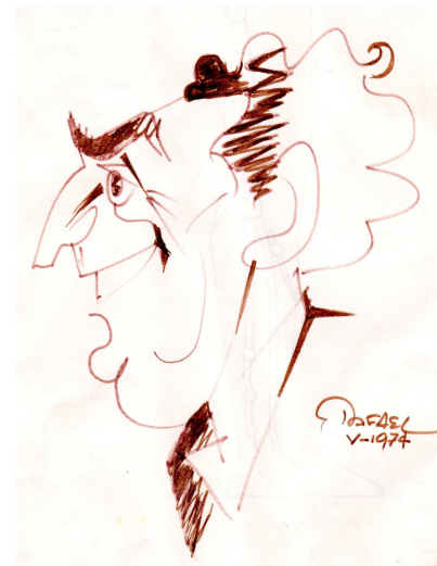
Caricatura di Glauco Bassi eseguita dal caricaturista Rafael.

flebologo" e il Compendio di terapia flebologica (1985) scritto in collaborazione con alcuni tra i più eminenti flebologi mondiali e tuttora considerato un testo di capitale importanza per lo studio della flebologia.