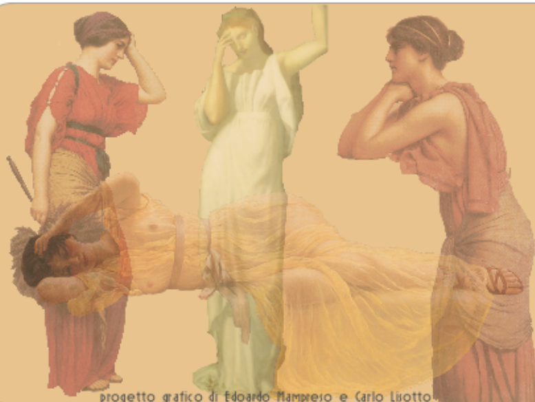
progetto grafico di Edoardo Mampreso e Carlo Lisotto.